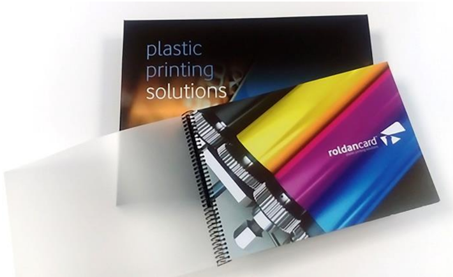
Le livre d'échantillons de Roldan Card