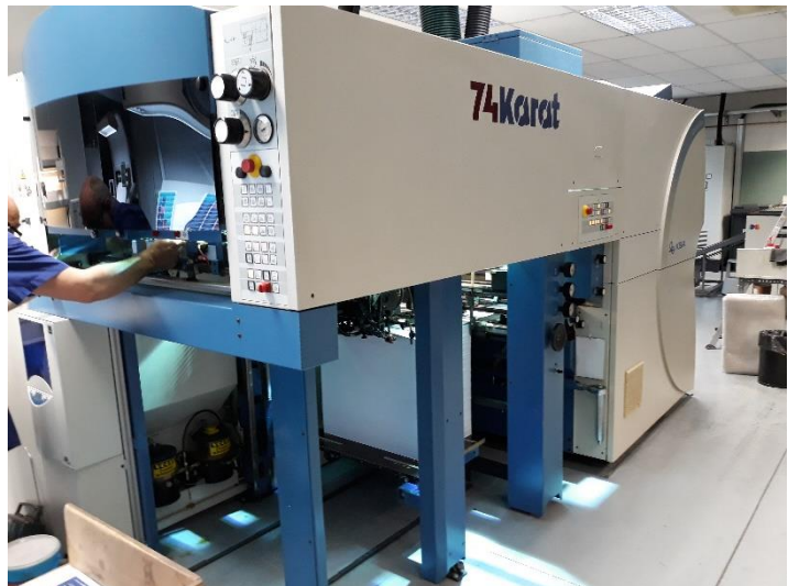
La presse d'impression KBA 74Karat

Les plaques sans mouillage Toray sont des plaques thermiques, négatives et non ablatives, qui s'utilisent sur les presses d'impression conventionnelles équipées de systèmes de régulation de la température d'encre, et qui génèrent un rendu de qualité sur du papier, du plastique et d'autres substrats, sans solution de mouillage. Les plaques de la famille IMPRIMA sont conçues pour répondre à des besoins d'application spécifiques. Ce sont les plaques IMPRIMA SB, SC et SD pour une haute définition et une impression de sécurité, l'IMPRIMA LB dédiée à l'impression haute résolution d'étiquettes, les plaques IMPRIMA WA et WB réservées aux applications offset rotative avec séchage à froid et thermique, et les plaques IMPRIMA MC pour le plastique.