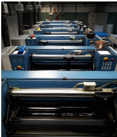
La presse d'impression KBA Rapida74

M. Roldan souligne aussi toute l'importance pour la société et pour ses clients des atouts environnementaux de l'impression offset sans mouillage en utilisant des plaques Toray, et affirme que « nous optons aussi pour l'impression sans mouillage car nous accordons de l'importance à la durabilité environnementale. L'impression offset sans mouillage n'utilise ni eau ni alcool isopropylique, et elle n'émet aucun composé organique volatil (COV) dans l'atmosphère. »