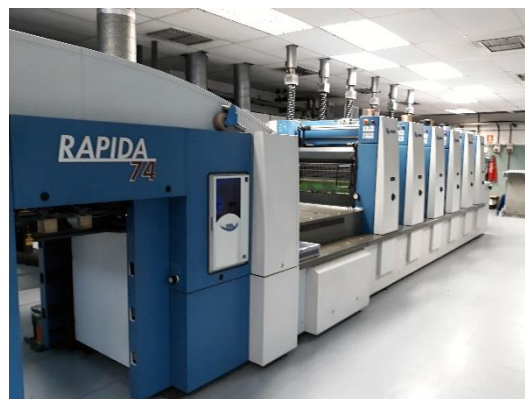
La presse d'impression KBA Rapida74