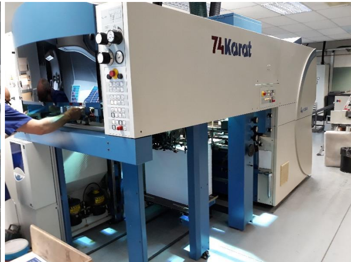
Impresora KBA 74Karat.

Las planchas Toray son planchas negativas, térmicas y no ablativas que se usan en máquinas de impresión tradicionales equipadas con sistemas de control térmico para imprimir de modo eficaz sobre papel, plástico y otros soportes sin soluciones de humectación. Las planchas IMPRIMA están pensadas para adaptarse a los requisitos de aplicaciones concretas. La gama incluye las planchas IMPRIMA SB, SC y SD (impresión de seguridad y alta definición), IMPRIMA LB (producción de etiquetas en alta resolución), IMPRIMA WA y WB (impresión offset rotativa por absorción o por calor) e IMPRIMA MC (para impresión sobre plásticos).