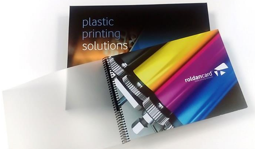
Mostrario de Roldan Card.

Las planchas Toray son planchas negativas, térmicas y no ablativas que se usan en máquinas de impresión tradicionales equipadas con sistemas de control térmico para imprimir de modo eficaz sobre papel, plástico y otros soportes sin soluciones de humectación. Las planchas IMPRIMA están pensadas para adaptarse a los requisitos de aplicaciones concretas. La gama incluye las planchas IMPRIMA SB, SC y SD (impresión de seguridad y alta definición), IMPRIMA LB (producción de etiquetas en alta resolución), IMPRIMA WA y WB (impresión offset rotativa por absorción o por calor) e IMPRIMA MC (para impresión sobre plásticos).