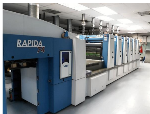
Macchina da stampa KBA Rapida74