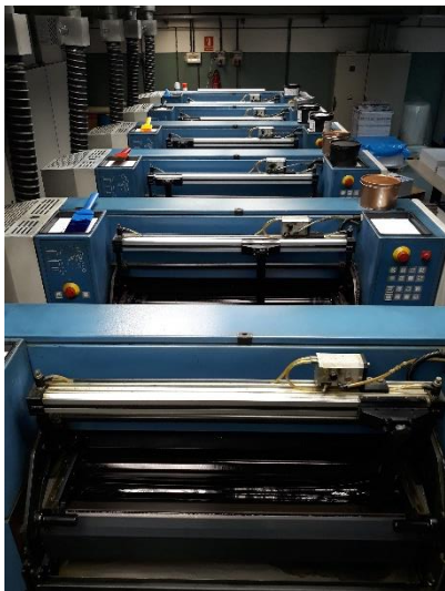
Macchina da stampa KBA Rapida74