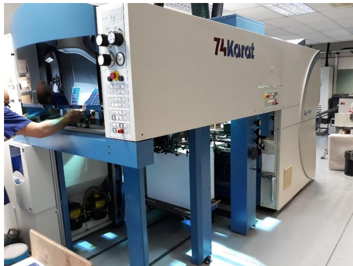
Macchina da stampa KBA 74Karat

Le lastre waterless Toray sono lastre termiche negative, non ablativo, utilizzate dalle macchine da stampa tradizionali dotate di sistemi di controllo della temperatura dell'inchiostro per stampare con efficacia su carta, plastica e altri supporti senza soluzioni di bagnatura. Le lastre della famiglia IMPRIMA sono state progettate per soddisfare esigenze specifiche a seconda delle applicazioni. Le tipologie disponibili includono le lastre IMPRIMA SB, SC e SD per la stampa di sicurezza e ad alta definizione, IMPRIMA LB per la stampa di etichette ad alta risoluzione, IMPRIMA WA e WB per le applicazioni offset con e senza forno e IMPRIMA MC per le materie plastiche.