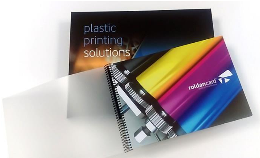
Libro di campioni di Roldan Card

Le lastre waterless Toray sono lastre termiche negative, non ablativo, utilizzate dalle macchine da stampa tradizionali dotate di sistemi di controllo della temperatura dell'inchiostro per stampare con efficacia su carta, plastica e altri supporti senza soluzioni di bagnatura. Le lastre della famiglia IMPRIMA sono state progettate per soddisfare esigenze specifiche a seconda delle applicazioni. Le tipologie disponibili includono le lastre IMPRIMA SB, SC e SD per la stampa di sicurezza e ad alta definizione, IMPRIMA LB per la stampa di etichette ad alta risoluzione, IMPRIMA WA e WB per le applicazioni offset con e senza forno e IMPRIMA MC per le materie plastiche.