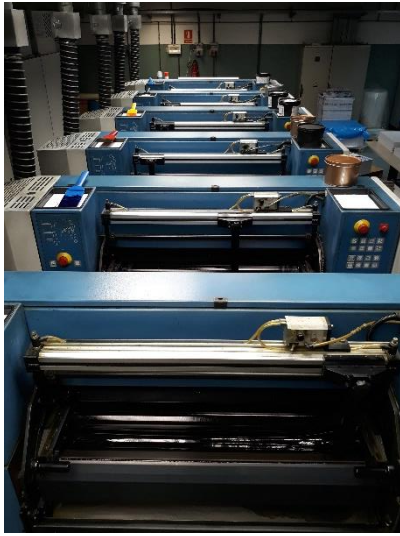
KBA Rapida 74 Druckmaschine