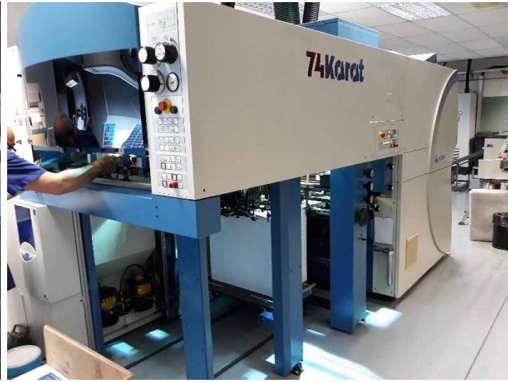
KBA 74 Karat Druckmaschine

Toray Wasserlos-Platten sind negativ arbeitende, nicht ablativ arbeitende Thermoplasten, die auf herkömmlichen, mit Farbwerktemperiersystemen ausgestatteten Offsetdruckmaschinen für den Druck auf Papier, Kunststoffen und anderen Bedruckstoffen ohne Feuchtmittel verwendet werden. Die Platten der IMPRIMA Familie wurden für die spezifischen Anforderungen unterschiedlicher Anwendungen entwickelt. Zur Produktfamilie gehören die IMPRIMA SB, SC und SD für hochauflösenden Druck und Sicherheitsdruck, die IMPRIMA LB für den hochauflösenden Etikettendruck, die IMPRIMA WA und WB für Coldset- und Heatset-Rollenoffsetanwendungen sowie die IMPRIMA MC für den Druck auf Kunststoffen.